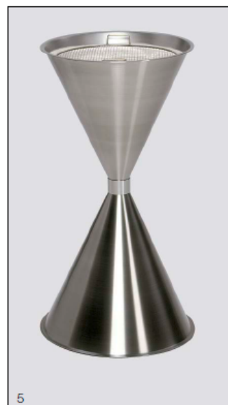
Photo : Version en acier INOX avec insert et tamis mobile en acier INOX, n° d'art. : 1160