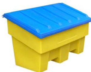
Nouveau : Coffre 300 litres Ref. CS300MP