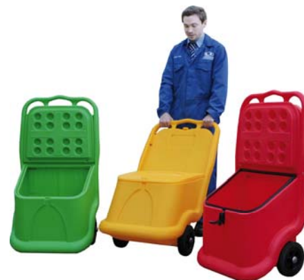
Bac mobile 75 Litres Réf. BMPE75