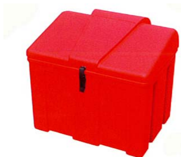
Coffre 110 litres Ref. CS110R/ECO + option kit de verrouillage