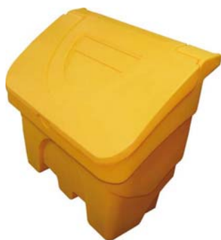
Coffre 200 litres Ref. CS200J/ECO