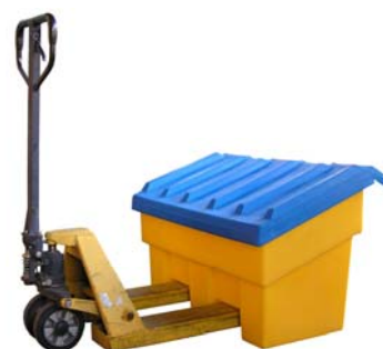
Coffre 180 litres Ref. CS180MP