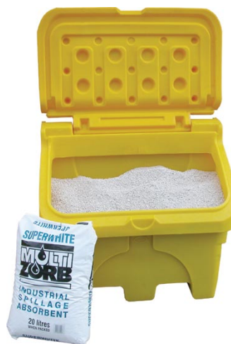
Coffre 130 litres Ref. CS130J/ECO