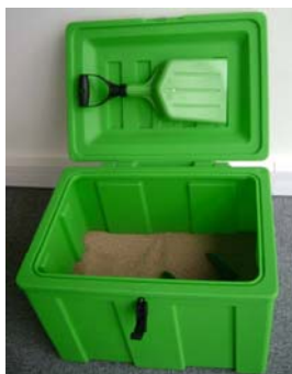
Coffre 110 litres Ref. CS110V/ECO + option pelle et fixation + kit de verrouillage

LIVRAISON OFFERTE en France continentale (hors îles)