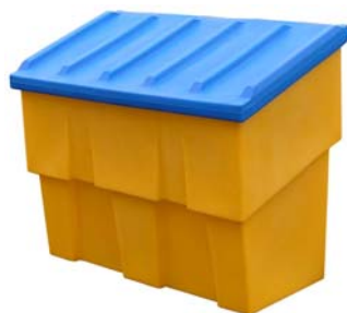
Nouveau : Coffre 500 litres Ref. CS500MP