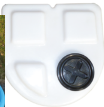
Cuve avec bac de rétention