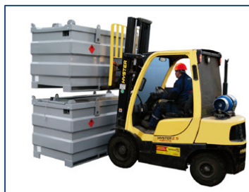
Empilable : 2 citernes pleines ou 3 citernes vides