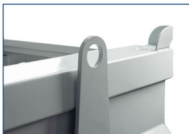
4 points de levage haute résistance