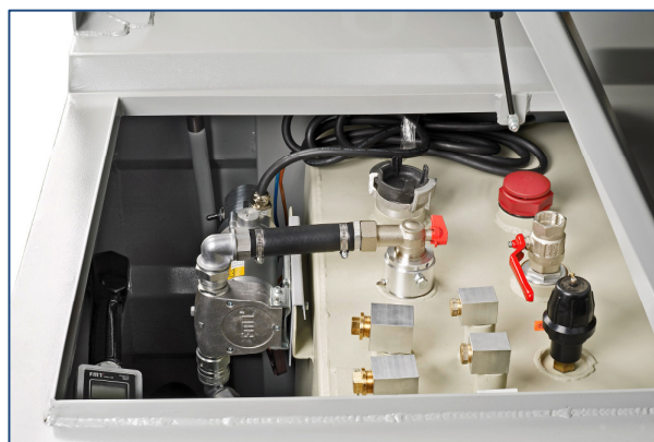
Cuve équipée d'une pompe