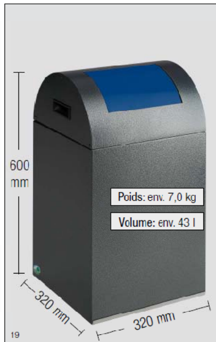
Photo: WSG 40R, argent antique, trappe basculante bleau gentiane, numéro d'article 21071