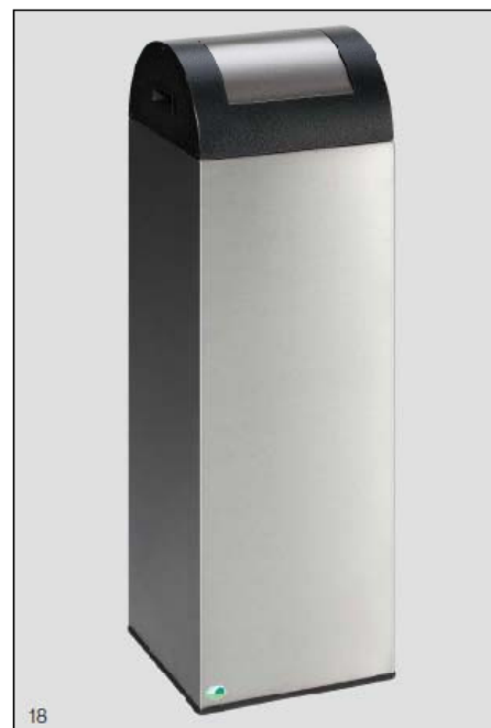
Photo: WSG 85R, INOX, numéro d'article 21062