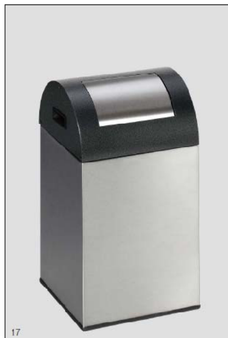
Photo: WSG 40R, INOX, numéro d'article 21061