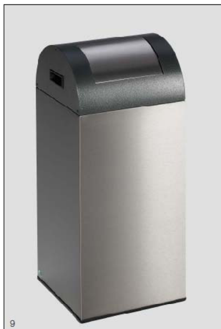
Photo: WSG 55R, INOX, numéro d'article 21060