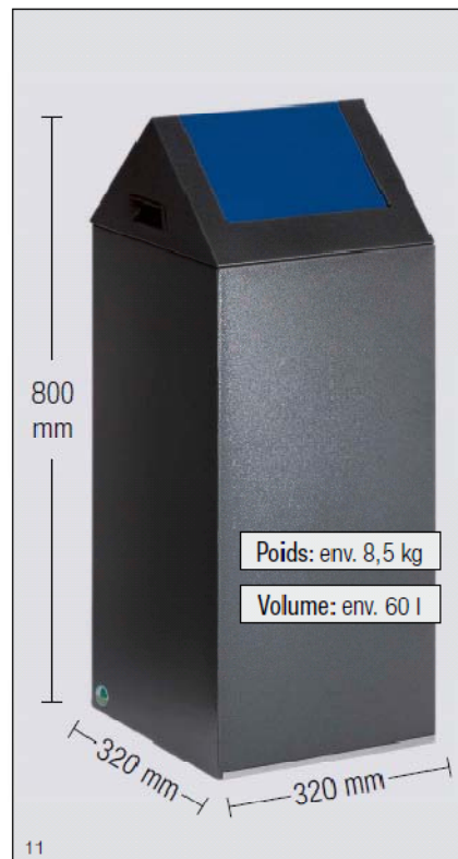
Photo: WSG 55S, argent antique, trappe basculante bleu gentiane, numéro d'article: 21021