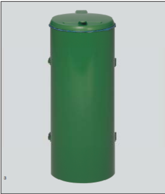
Photo : modèle VERT ref 1002