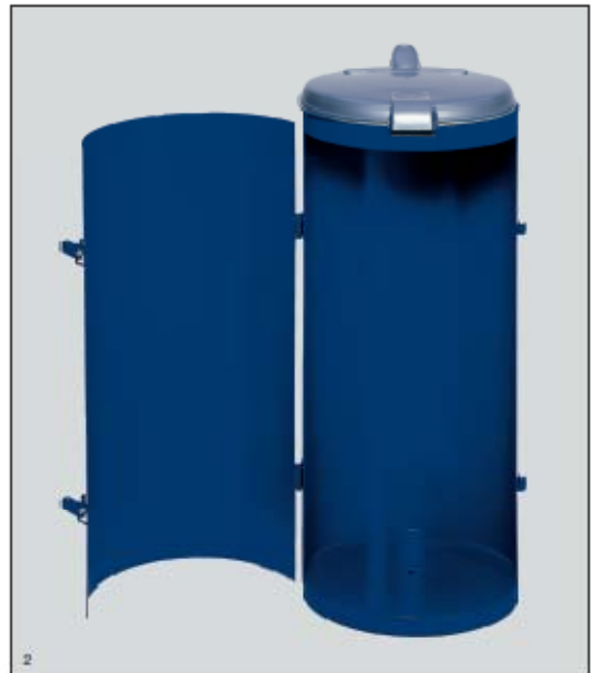
Photo : modèle BLEU GENTIANE ref 10161